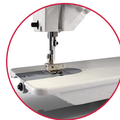
Table d'extension incluse